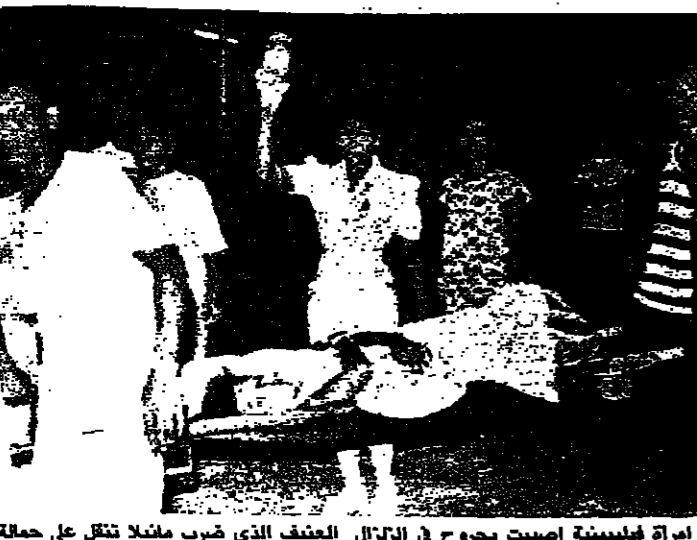
امرأة فلبينية اصيبت بجروح في الزلزال العنيف الذي ضرب مانيلا تنقل على حملة اسعاف الى المستشفى

تكرت الاداعات الفلبينية ان ٢٩ شخصا على الاقل لقوا مصرعهم في الهزة الارضية العنيفة، التي ضربت مانيلا والقسم الاكبر من جزيرة لوزون اكبر جزر الفلبين صباح امس. وشعر سكان مانيلا لاكثر من دقيقتين بظهزة، التي بلغت بقوتها اكثر من ٧ درجات حسب مقياس ريختر، وغادر الاف الاشخاص المنكوبين منازلهم على عجل.